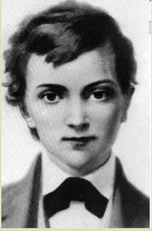
Santo Domingo Savio

Domingo Savio fue el primer alumno de Don Bosco en convertirse santo.